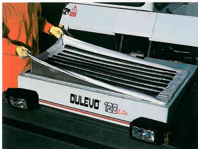
Le système de filtration