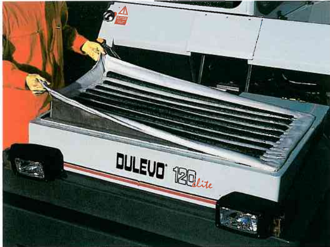
Le système de filtration